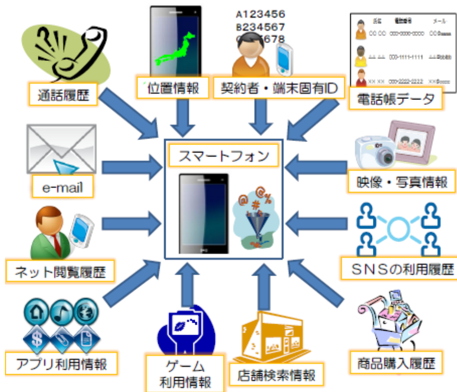
図1 スマートフォンに蓄積される主な利用者情報