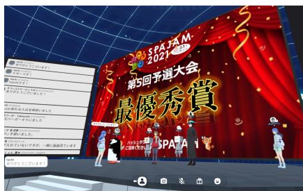
VR空間等のITツール等を活用

新型コロナウイルス感染防止の観点からリアルハッカソンを開催することが困難な状況となっておりますが、このような危機的な状況をポジティブに捉えて、ビデオ会議やチャットツール等のITツールを活用したオンラインハッカソンのフォーマットを開発しました。