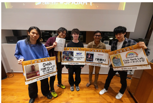
最優秀賞チーム「ソラエフ」