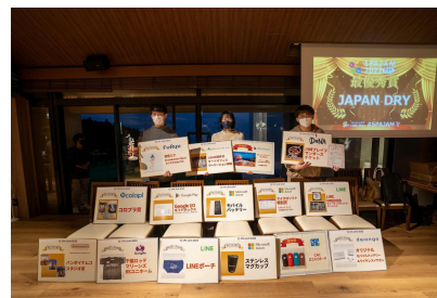
本選では豪華賞品を提供